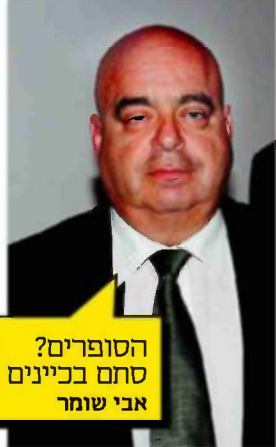
הסופרים? סתם בכיינים אבי שומר