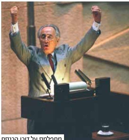
מתפלמס על דוכן הכנסת