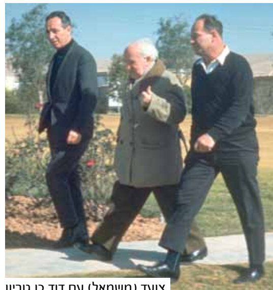
צועד (משמאל) עם דוד בן גוריון