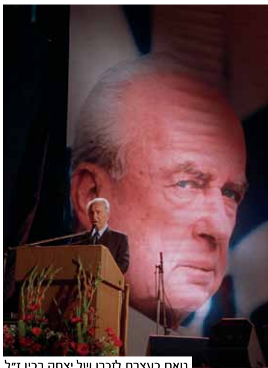
נואם בעצרת לזכרו של יצחק רבין ז"ל

במהלך כל הקריירה הענפה שלו, איפיינו את פרס תכונות כדוגמת חזון, יצירתיות, עקביות ונחישות. העולה החדש