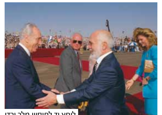
לוחץ יד לחוסין מלך ירדן