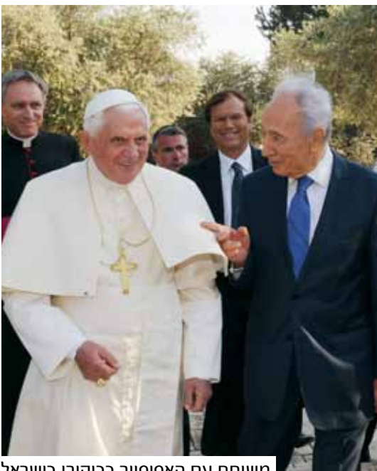
משוחח עם האפיפיור בביקורו בישראל