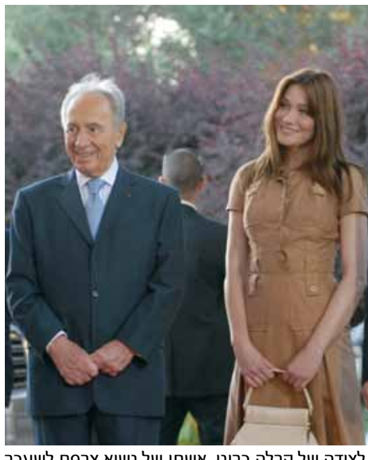
לצידה של קרלה ברואי, אשתו של נשיא צרפת לשעבר